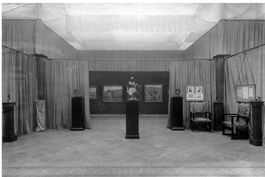
Exposició inaugural de la Sala Parés després del traspàs i les reformes de l'estiu de 1925.