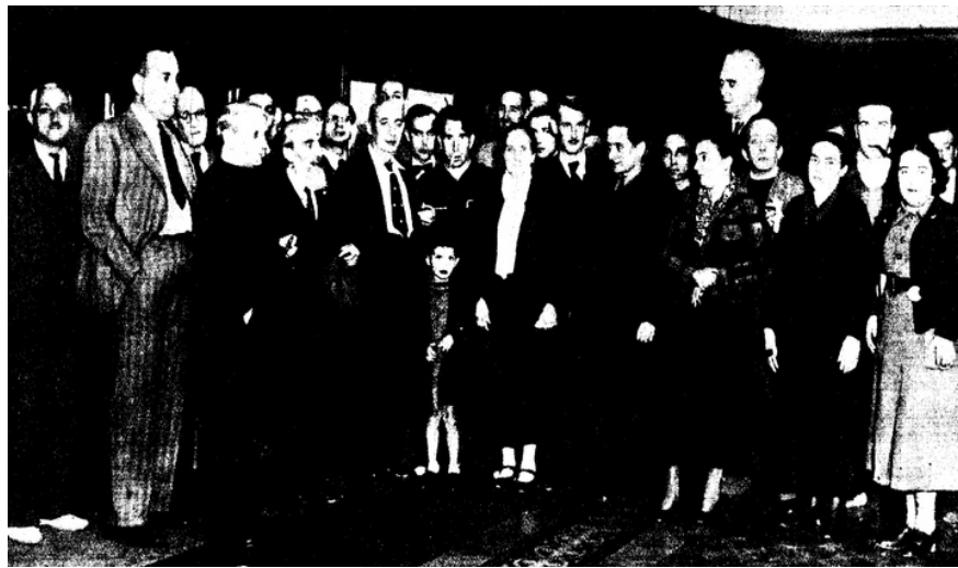
Inauguració de l'exposició de Gustavo Cochet a la Sala Parés, 31 d'octubre de 1936. [ La Vanguardia , 3 de novembre de 1936, p. 4].

A mode de curiositat i fruit del tens ambient polític que es començava a viure a la capital catalana posteriorment a l'alçament, val la pena mencionar l'única exposició que es va celebrar a la Sala Parés durant el conflicte. Va tenir lloc del 31 d'octubre al 15 de novembre de 1936 i, en aquell període, les portes es van tornar a obrir, tot i que va ser per imposició i pressions polítiques.[9] La mostra en qüestió va ser una individual de l'artista argentí Gustavo Cochet (1894-1979), militant de la Federación Anarquista Ibérica. Cochet va arribar a Barcelona cap el 1915 i va realitzar la seva primera exposició a les Galeries Dalmau (1919). Després de diversos viatges per l'Argentina i París, va retornar a la Ciutat Comtal amb la seva família el 1934 i va treballar a la CNT pel govern de la Segona República.[10] Tot això explica l'exposició (imposada) a la Sala Parés pocs mesos després de l'esclat de la guerra, mostra organitzada per la CNT i la Federación Local de Grupos Anarquistas. Es tractava d'una antològica que reunia obres de Cochet dels seus últims vint-i-cinc anys de producció, essent considerada "la més important que fins aleshores havia celebrat aquest artista".[11] Els noranta quadres van distribuir-se a les dues sales de la galeria i, des de la premsa, es feia una crida als amants de l'art de la ciutat, especialment als "camarades antifeixistes".[12]