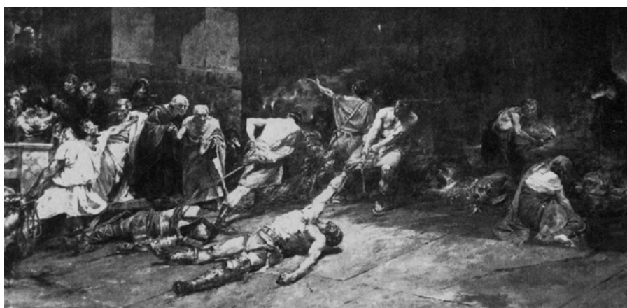
Juan Luna y Novicio. Spoliarium , 1884, oli sobre tela, 4,2 x 7,6 m.

El 14 de gener de 1886 s'obria al públic la mostra exclusiva del cèlebre quadre Spoliarium del filipí Juan Luna y Novicio (1857-1899), artista format a l'Academia de Dibujo y Pintura de Manila i a la Real Academia de Bellas Artes de San Fernando de Madrid i seguidor de la pintura d'Eduardo Rosales. Va ser, sense cap dubte, una de les exposicions més concorregudes de tota la història de la galeria, tot i la crisi sanitària que patia el país i, sobretot, la ciutat de Barcelona en aquell moment. L'obra (de 4,2 per 7,6 metres) havia estat exposada prèviament a l'Exposición Nacional de Bellas Artes de Madrid el 1884, rebent una bona acollida per la crítica i aconseguint una medalla de primera classe.[2] Dos anys més tard era presentada a Barcelona, a la galeria de Petritxol juntament a altres teles de Luna. La cua de visitants arribava a La Rambla, i per il·luminar el gran quadre es va instal·lar una bateria de llums supletòria. Tal com es recull a les cròniques de l'època, les multituds desfilaven interminablement davant el Spoliarium , que ocupava el centre de la sala gran. Fins i tot, La Vanguardia va oferir als seus lectors una làmina amb la reproducció de l'obra.